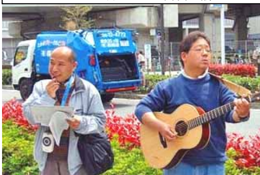
にぎやかに唄いながら署名の訴え

約130筆の署名を集めることができました。久しぶりに、この行動に参加した労組員から、組合員さんの反応もよく、楽しく行動に参加できた、今後も参加したい、という感想を寄せていただきました。