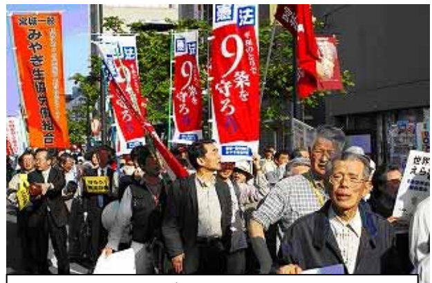
みやぎ生協職員の行進

アメリカのイラク戦争を「テロリズムを増加させ、国際法と人権を後戻りさせた」と批判し、北アイルランドでの経験を踏まえ「民