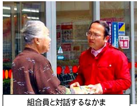
組合員と対話するなかま

約130筆の署名を集めることができました。久しぶりに、この行動に参加した労組員から、組合員さんの反応もよく、楽しく行動に参加できた、今後も参加したい、という感想を寄せていただきました。