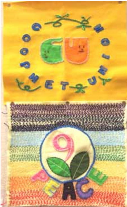
第二位 コープネット 縮洞美奈子