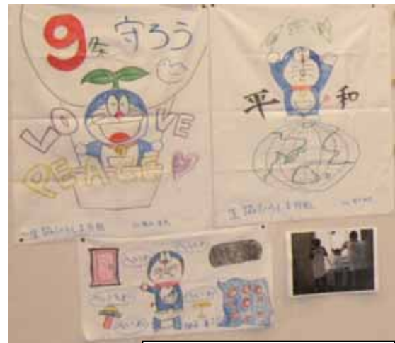
佐世保賞 ひろしま 植永光則