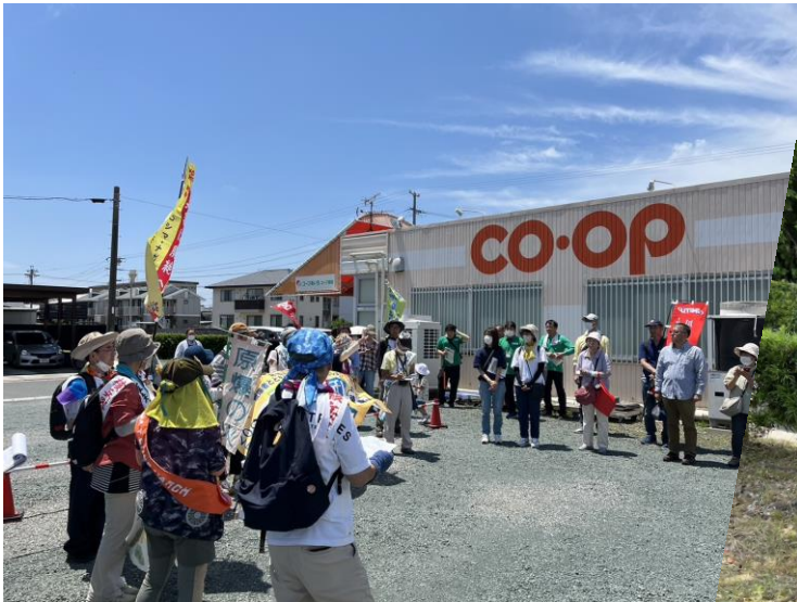
6/1、愛知豊川蒲郡コース、諏訪店前。多くのなかまが参加しました。